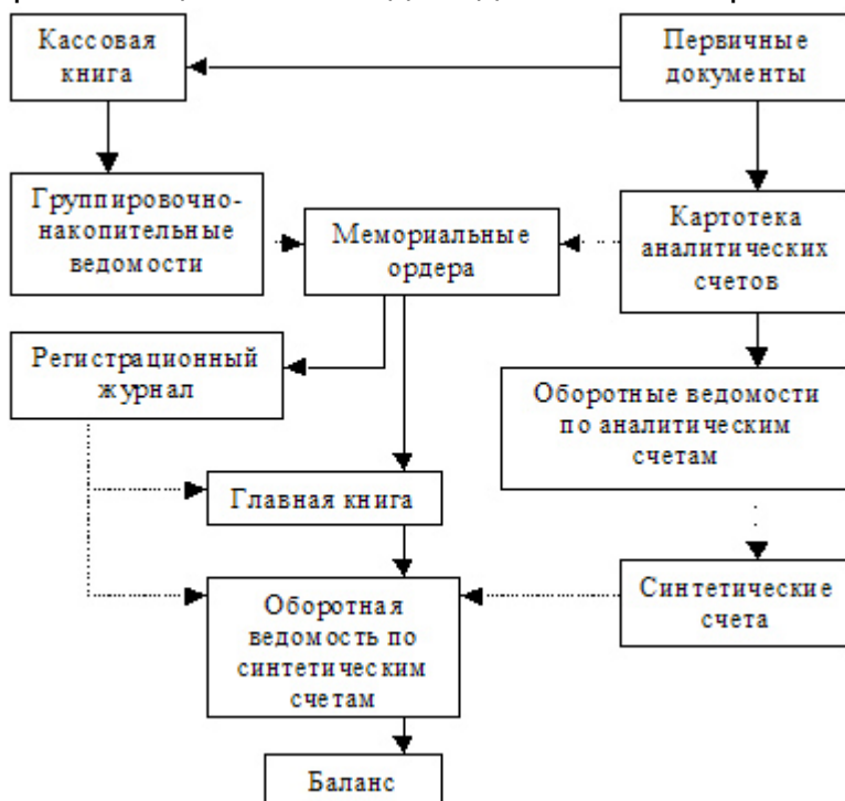
Рис. 1.1. мемориально-ордерной формы (Сплошный линии последовательность выполнения записей, — сверку итогов).

Система учета соответствовать виду деятельности, быть достоверной, исключать пропуска о хозяйственной деятельности, осуществлять любую о состоянии, движении или средств , обеспечивать простоту в хозяйственных операций и бухгалтерской отчетности, защиту от коммерческой информации, приемлемую себестоимость. применяемой системы должна прямо пропорциональна оборотам организации и не ее доходность. Мемориально-ордерная учета: